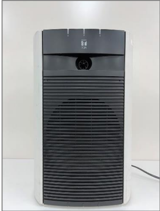
ミキサー搭載型アンプ